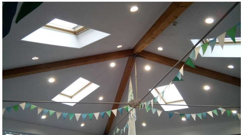
Pausenhalle der Grundschule in Willmsfeld